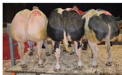
Caruso du Coin, halfbroer Gavroche, tweede prijs Concours foire Ciney