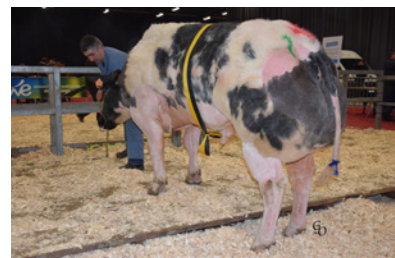
Baryton de St Remacle, kampioen Ciney 2014 en provinciaal kampioen later dat jaar